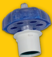
Art.-Nr. 801010 0008 KemTec-econstop-Ventil mit Hygienering für alle Adapter und Grundadapter