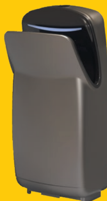
Art.-Nr. 801012 0014 gold