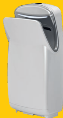
Art.-Nr. 801012 0016 white