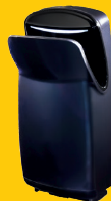
Art.-Nr. 801012 0013 blue