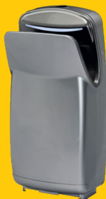
Art.-Nr. 801012 0015 silver